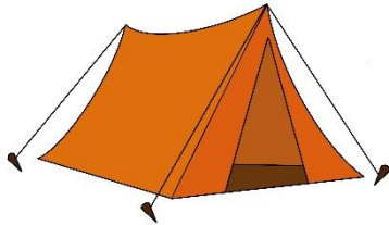
26. - 29.05.2023 - PFILA