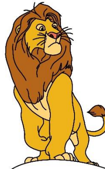
10.06.2023 - MUFASA