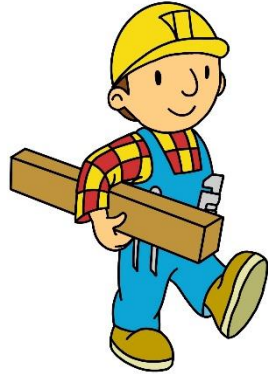
25.02.2023 - BOB DER BAUMEISTER