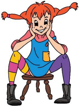
11.02.2023 - PIPPI LANGSTRUMPF