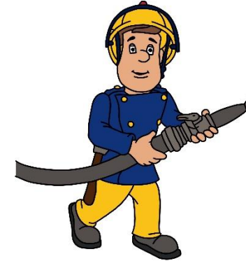
25.03.2023 - FEUERWEHRMANN SAM