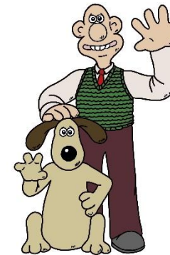
24.06.2023 - WALLACE & GROMIT