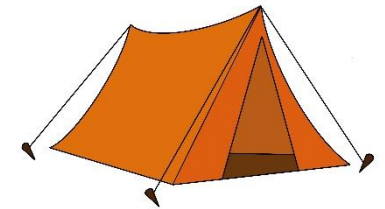
08. - 15.07.2023 - SOLA

WER: 2. KINDERGARTEN BIS UND MIT 6. KLASSE