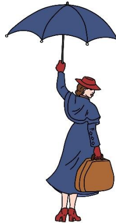
11.03.2023 - MARY POPPINS